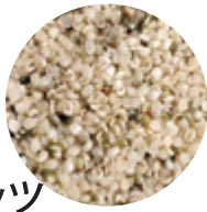
有機麻の実ナッツ 160g