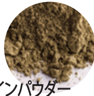
有機ヘンププロテインパウダー 160g